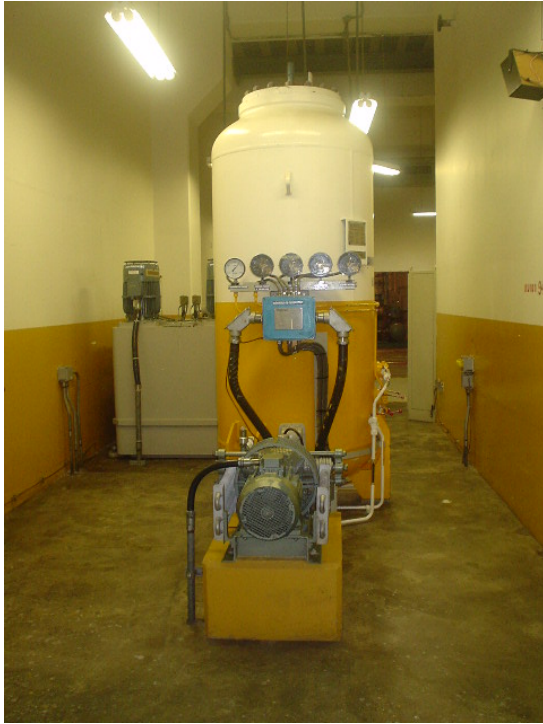
Sistema de Regulación