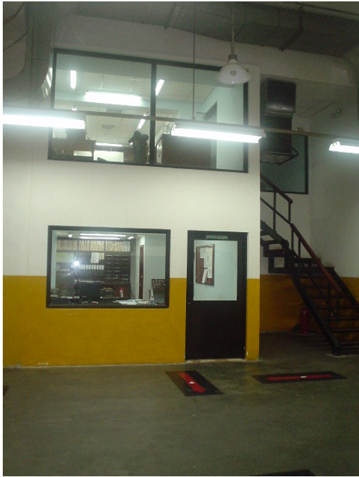
Oficinas de Tecnólogos