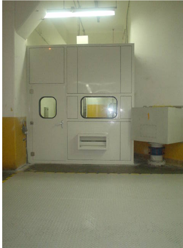
Cabina Piloto Recubriendo el Sistema de Regulación Unidad 1