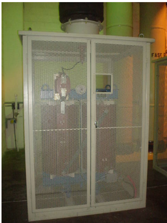
Centro de Carga