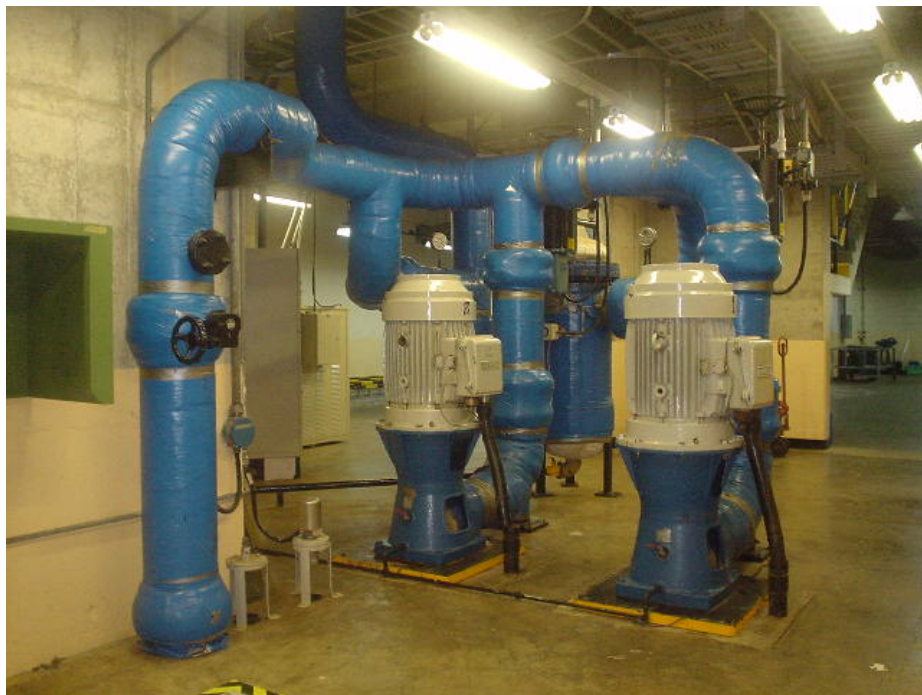
Sistema de Ventilación